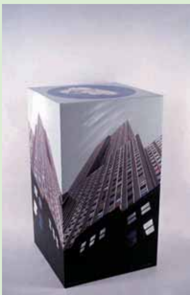
New York city. 2003

Una de les grans espines que portem clavades les lesbianes