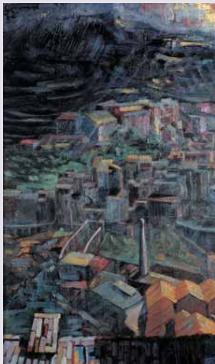
1962 paisatge Alcoi

Davant de la nul·la resposta obtinguda, veiem necessari l'inici de mobilitzacions al començament del curs, no sols per qüestions econòmiques, sinó en defensa de la represa de les negociacions de tots els temes pendents: plantilles, mesures per a les persones afectades per centres en crisi, i, en general, en defensa del compliment de tots els acords negociats.