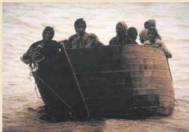
Un mar de «pateres». 2006. Fuerteventura

Pense que les coses han d'estar ben fetes. Jo no sé parlar molt bé i per això faig poques entrevistes, però procure pintar tan bé com puc, ètica i estètica.