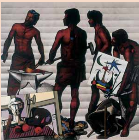
Fornall de ficcions. 1985-88

Gràcies per premiar-me i per escoltar-me.